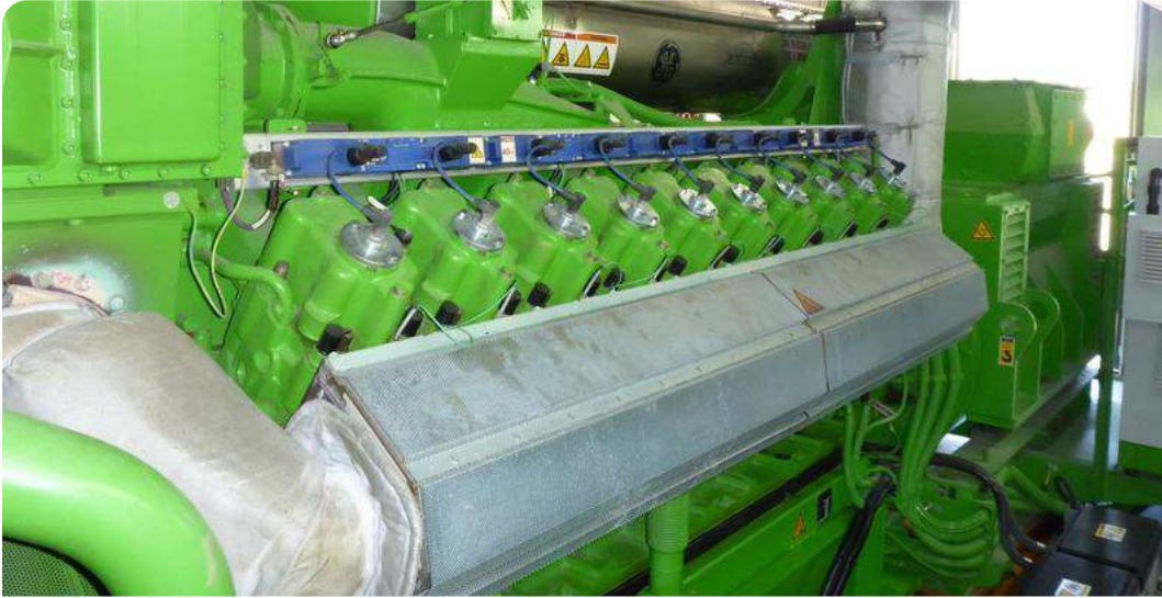
Abb. 1: Das BHKW der H. & E. Reinert Westfälische Privat-Fleischerei GmbH versorgt das Unternehmen mit 1480 kW elektrisch sowie mit einer Feuerungswärmeleistung von 3430 kW thermisch.